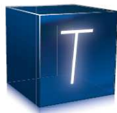
Training Vertiefung wesentlicher Inhalte. Praxisbezug herstellen.