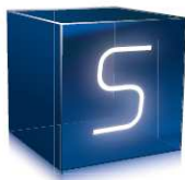
Referat / Seminar Grundlagen, einheitliches Wissensniveau.

und verfolgt damit das Ziel, Ihr Unternehmen bei der Vermarktung Ihrer „unsichtbaren“ Leistungen so zu unterstützen, dass Sie verbesserte ökonomische Erfolge erreichen.