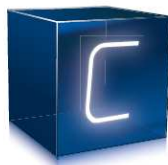
Consulting Stärken ausbauen und festigen. Schwachstellen reduzieren.

Ihre Erfolgsverbesserung wird durch den optimalen Einsatz der geeigneten Dienstleistungs-Marketing-Tools erreicht.